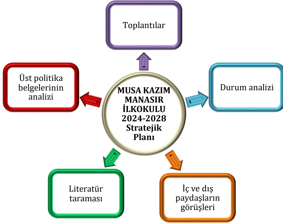
Şekil 1: Stratejik Plan Oluşum Şeması

2024-2028 Stratejik Plan çalışmalarının başladığı 06 /10/ 2022 tarihinde Milli Eğitim Bakanlığı Strateji Geliştirme Başkanlığı tarafından onaylanan ve yayımlanan 16702371 sayılı resmi yazı ile müdürlüğümüz personeline duyurulmuştur. Birimlerin çalışmalara azami katılım ve desteklerinin, açıklama yazısı ve ekler doğrultusundaki dokümanlardan faydalanılarak yapılması sağlanmıştır.