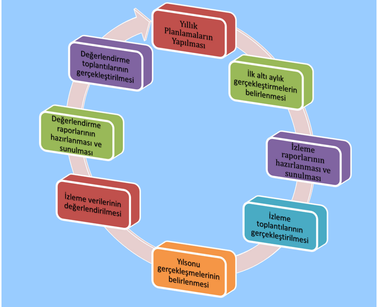
Şekil 4: İzleme ve Değerlendirme Süreci

Bakanlık tarafından; Stratejik Plan izleme ve değerlendirme sürecinde hızlı ve güvenli veri akışını mümkün kılmak, mükerrerliği önlemek ve katılımılığı artırmak amacıyla Stratejik Plan İzleme ve Değerlendirme Modülü geliştirilmiştir. Modül 2019 yılının ikinci yarısından itibaren kademeli biçimde uygulamaya alınmıştır.